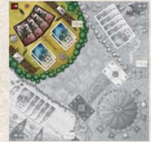
LANCELOT ET LE DRAGON