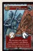
Lancelot & Dragon