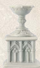
Le Saint Graal

Si vous tombez à 0 Points de Bravoure (en raison d'un sacrifice généreux ou pour toute autre raison au cours de la partie), vous passez immédiatement de vie à trépas et quittez la partie. Tout ce que vous possédiez est perdu. Si elles étaient vôtres, Excalibur et l'Armure de Lancelot sont retirées du jeu. Vos cartes Blanches rejoignent la pile de défausse.