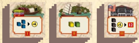
42 Tuiles Bâtiments