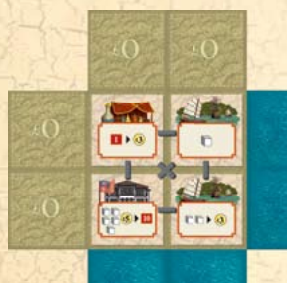
Tuile de départ