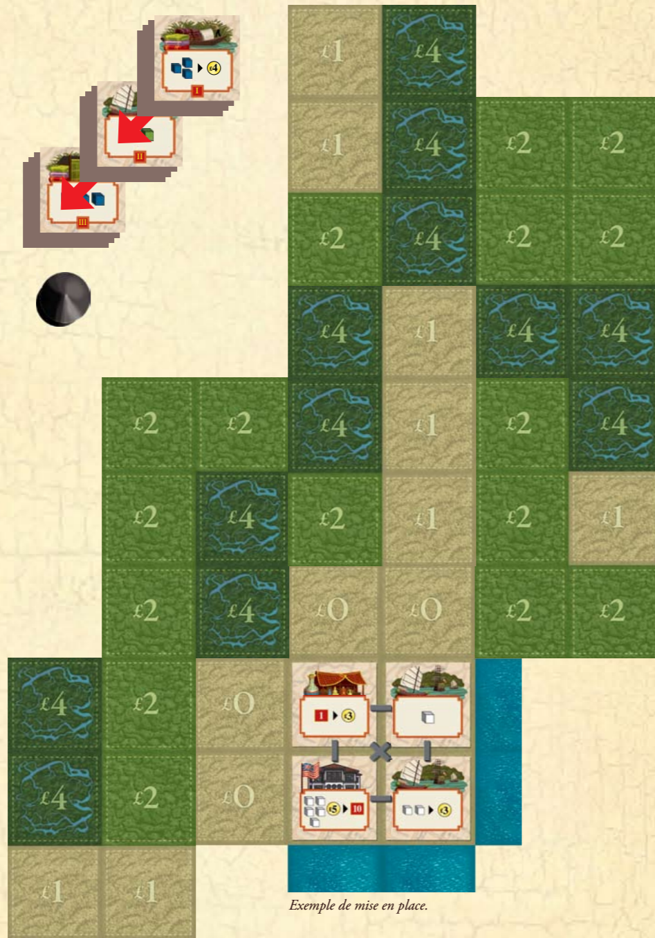
Exemple de mise en place.

Les jetons personnage (marqueurs de points de victoire des joueurs) sont empilés en ordre aléatoire sur l'emplacement n°5 de la piste de score. Le joueur dont le marqueur est situé en bas de cette pile reçoit la tuile Raffles.