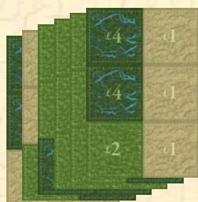
6 Tuiles de terrain composées de 6 parcelles chacune