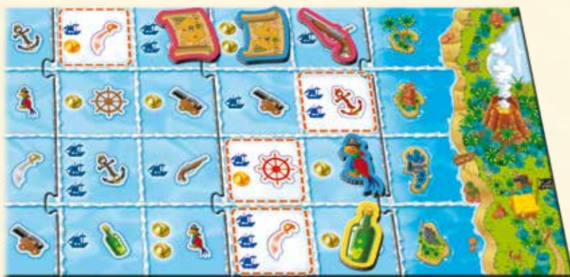
A ce stade de la partie, les objets peuvent être déposés sur ces quatre emplacements.

Dès qu'un joueur pense avoir trouvé le bon objet dans son sac, il le sort et le regarde. Si c'est bien l'objet qu'il lui faut, il se dépêche de le placer sur le plateau à l'emplacement de l'image correspondante. A partir de ce moment là, les autres joueurs peuvent remplir l'emplacement suivant sur le plateau.