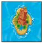
1 ère carte île