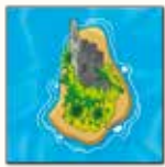
2 ème carte île