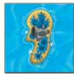
4 ème carte île