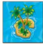
3 ème carte île