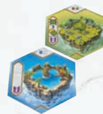
Placement illégal, une tuile doit être placée sur deux tuiles de l'étage inférieur.

3 Au moins une de ces deux tuiles doit être de la même couleur que la tuile ainsi placée.