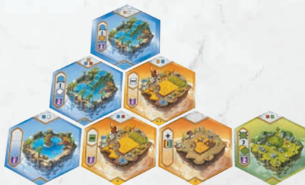
Cet univers est légal.

Si l'on respecte scrupuleusement ces règles, on peut parfaitement commencer le deuxième étage, voire le troisième, avant même d'avoir terminé son premier étage de 5 tuiles.