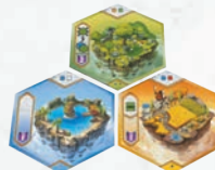
Placement illégal, une des tuiles de l'étage inférieur doit être de la même couleur que la tuile placée.

3 Au moins une de ces deux tuiles doit être de la même couleur que la tuile ainsi placée.